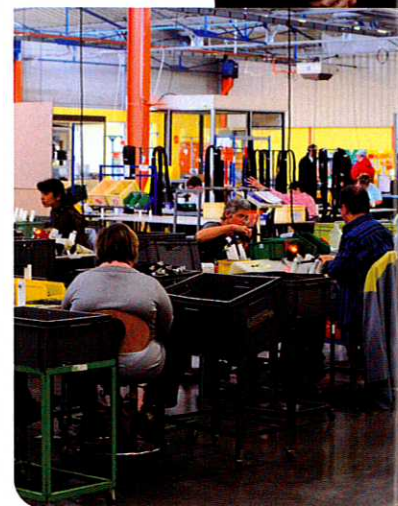
Chaîne de montage d'un atelier spécialisé de l'ADAPEI

Depuis, tous les repas partent de la cuisine centrale, inaugurée à Etupes en janvier 2008, pour être livrés et remis en température sur les différents établissements. "Nous cuisinons pour une population qui va de la petite enfance au troisième âge, poursuit-il, et bien sûr les repas sont adaptés aux différents handicaps". Soit plus d'une vingtaine de déclinaisons pour un même plat, avec en moyenne 1 200 repas par jour.